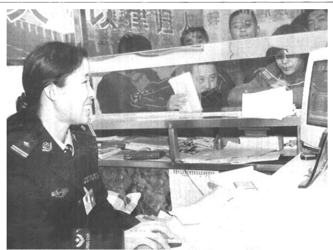
市公安局车辆管理所把窗口服务作为形象工程的重中之重，自今年1月1日截至目前，已为新车办理挂牌11500余台，比去年同期增长近2000台。窗口干警平均每天受理业务80余台次，其优质服务受到好评。

广饶讯 近日广饶县大码头乡东燕村燕安友夫妇看着满圈膘肥体壮的猪羊，满院金黄的玉米，心里像吃了蜜一般甜，他们养猪养羊只有半年光景，纯收入2万元。 今年春天，燕安友夫妇投资5万元建起了一个中型规模的自繁自养的养殖场，从潍坊、寿光等地购进了30只毛肉兼用型优良品种小尾寒羊和60头良种仔猪，进行规模养殖。为提高养殖效益，他们订购了《山东科技报》、《小尾寒羊科学养殖技术》等报刊，一边学习科学养殖知识，一边积累养殖经验。在饲养方面，探索出了生态养殖提高收益的做法。养殖过程中，充分发挥生物链作用，一是大搞玉米秸、豆秸等农作物青贮，二是再用猪羊牲畜粪给农作物追肥，既节省了资金，变废为宝，避免了资源浪费，又不误农活，取得了一举两得的成效。 羊群田间欢，猪在圈中肥。燕安友在饲养场精心管护着仔猪，妻子在田间地头赶放羊群，经过三个半月的科学喂养，30只小尾寒羊、60多头大肥猪全部出栏，去掉成本，每只羊纯收入160元，每头猪纯收入250元左右，并繁育50多头猪崽，加上一茬喜获丰收的玉米，收入可观。初试成功的燕安友夫妇信心倍增，认准了生态养殖这一条发家致富的好门路，目前，又扩大了养殖规模，自繁自育仔猪达500多头，小尾寒羊达100余只。目前，羊群、猪崽长势喜人，春节前将全部出栏。（董保廷 张学玲 刘秀美）