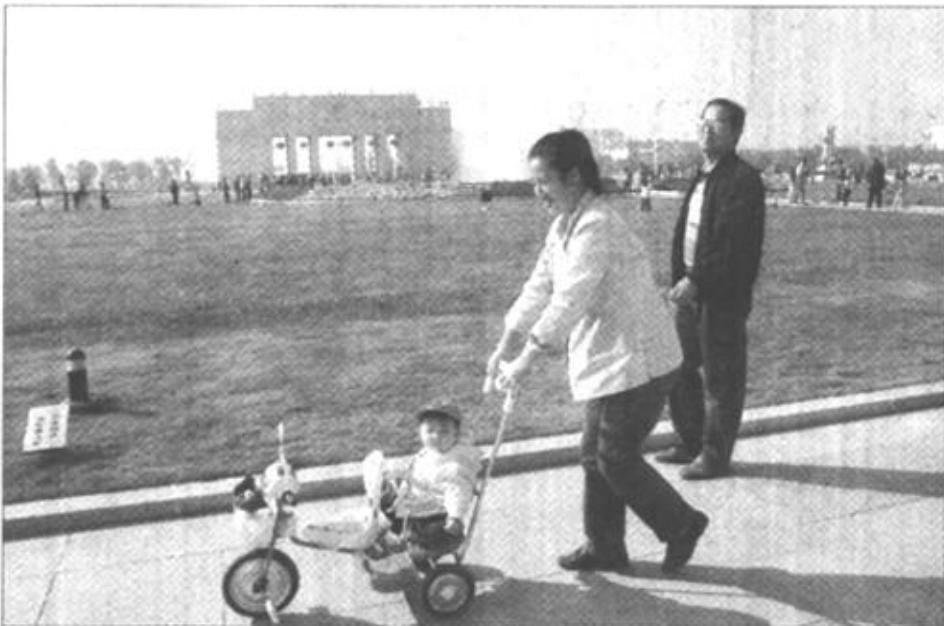
我市实施的“大绿地、大水面、大空间”城市规划思路已初见成效。尤其是中心城区，夏秋时节，蓝天白云，碧水环绕，绿草如茵，充满诗情画意。

时下，东营市的主要街道路口，红绿灯亮起时便发出嗒嗒嗒声，原来这是对盲人过街时进行的提示音响装置。不光这些设施建起来，在人行道上还为方便盲人和肢体残疾的人改造出了大坡道口、小坡道口，铺设了有利于盲人行走的花砖路……这些设施的建设，充分体现了东营市委、市政府对残疾人的关怀和浓情。从2003年初，东营市把无障碍设施建