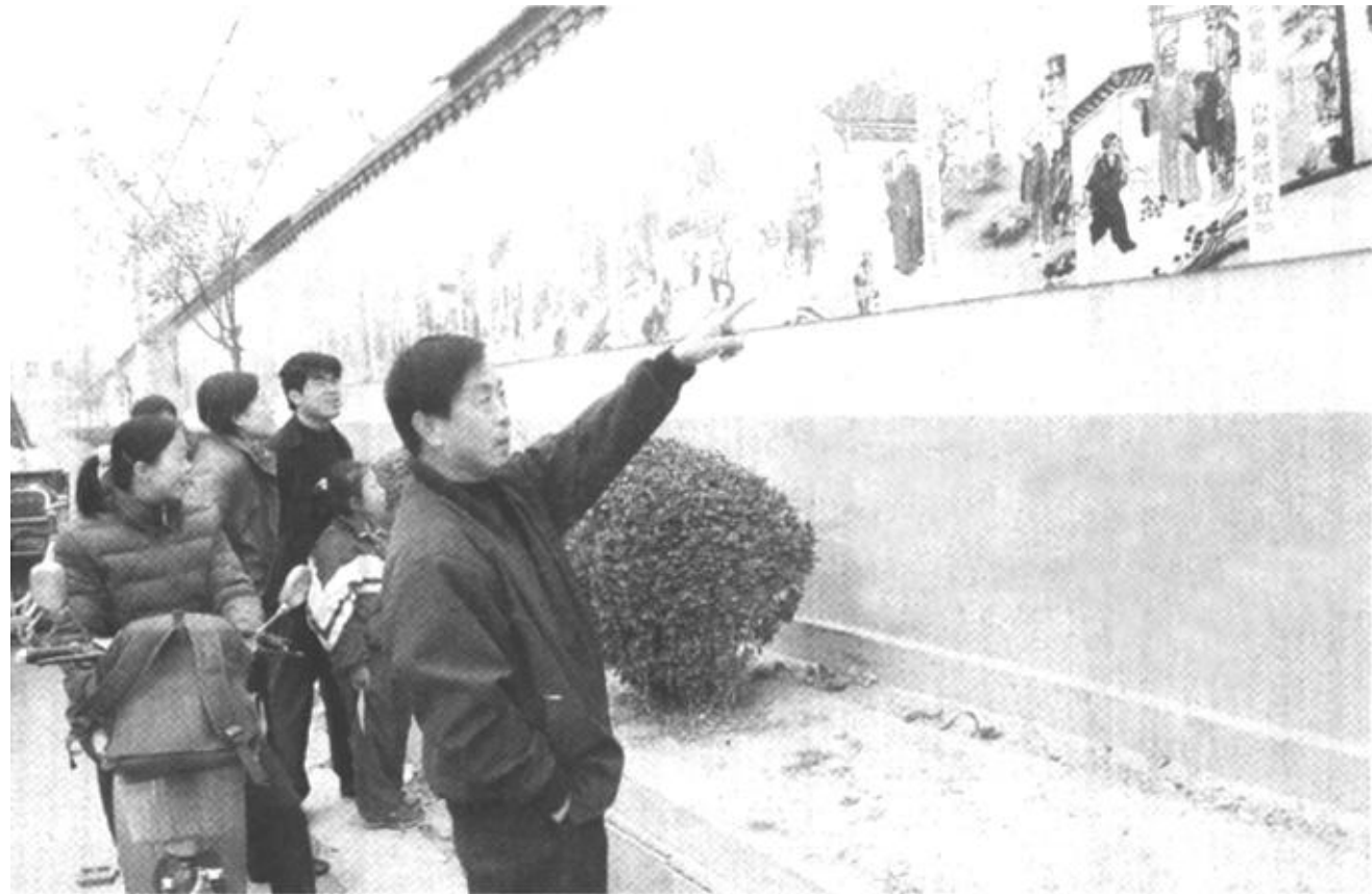
广饶县广饶镇十分重视“文明诚信一条街”建设活动。目前,该镇已有29个村建成文明诚信一条街,发挥了良好的宣传、教育作用。

创新思路抓服务。该局推行了联系企业制度,建立了干部职工服务企业情况档案。为推动这项工作的开展,开展了“五个一”为内容的创新活动。